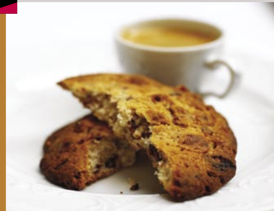
JIVARA & VALNØDDE COOKIES

JIVARA LACTÉ & VALNØDDE COOKIES 250 g blødt smør 250 g sukker 1 knivsp. salt 2 æg 275 g hvedemel 1 tsk bagepulver 200 g grofthakkede valnødder 200 g grofthakket Valrhona Jivara Lacté mælkechokolade